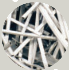
Sammeln von Aluminium-Alt- und Neuschrott