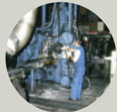
Pressen von Aluminiumprofilen